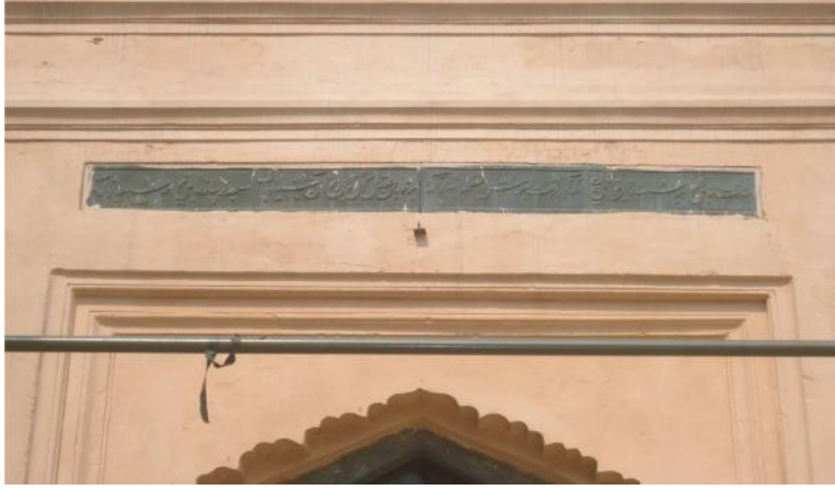
চিত্র: ১ (হাজী খাজা শাহবাজ মসজিদের শিলালিপি)