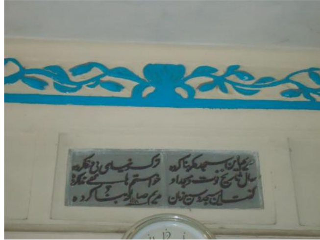
চিত্র: ২ (মরিয়ম সালেহা মসজিদের শিলালিপি)